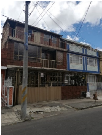
Fotografía No 1. Fachada predio