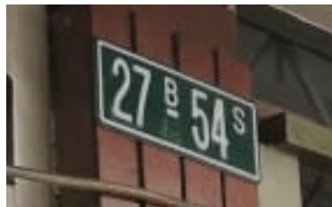
Fotografía No 2. Nomenclatura del predio