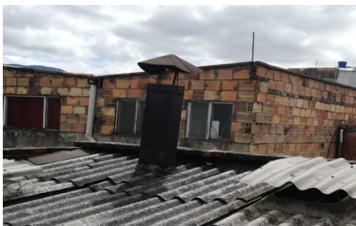
Fotografía No 5. Ducto