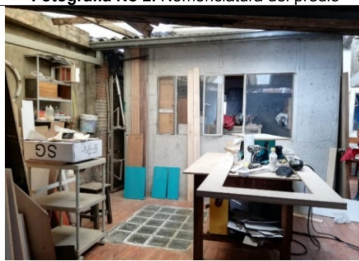
Fotografía No 4. Área de armado